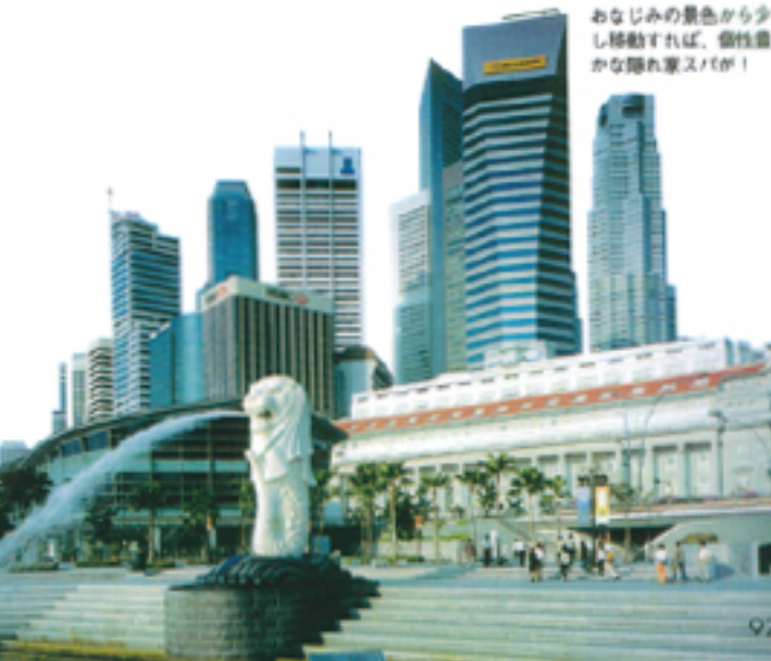
おなじみの景色から少し移動すれば、個性豊かな隠れ家スパが！

a 体質に合わせて調合したオイルを贅沢に使用。これが本場だそう。b ローカルなショッピングモールの5階。最初は少し驚くかも？