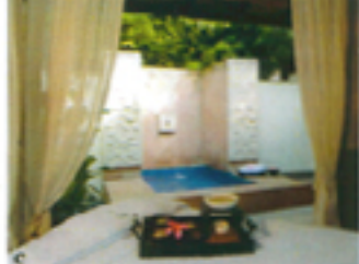
▲アジア熱、モロッコ式ジャララシー・スチームバスを導入。蒸気バックとハーブのスチームで肌を浄化。b フルーツやスパイスをふんだんに使用する「トロピカル・グロー」コースも人気。c 屋外のトリートメントルームを指定したい