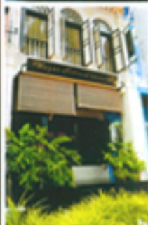
a 使用素材はほとんどパリから輸入し、自由に調合する。b 雑貨買いが楽しいブティック・ストリートにある。c 一歩足を踏み入れると不思議な静寂が漂う。インテリアのセンスも抜群